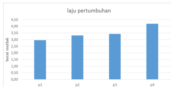
Gambar 1. Laju pertumbuhan berat mutlak selama 28 hari.

Hasil dari pertumbuhan bobot benih ikan lele sangkuriang selama 30 hari pemeliharaan, dengan perlakuan P1 ( 100% pakan komersil), P2 ( pakan komersil 80% + tepung cangkang kerang hijau 20% ), P3( pakan komersil 65% + tepung cangkang kerang hijau 35%), P4 ( pakan komersil 50% + tepung cangkang kerang hijau 50%). Yaitu penambahan berat tertinggi selama pemeliharaan terdapat pada perlakuan P4 sebesar 4,19 g, kemudian di ikuti perlakuan P3 sebesar 3,42 g, kemudian diikuti perlakuan P2 sebesar 3,05 g dan terendah terdapat pada perlakuan P1 sebesar 2,96 g. Berat ikan lele dapat dilihat pada gambar 1.