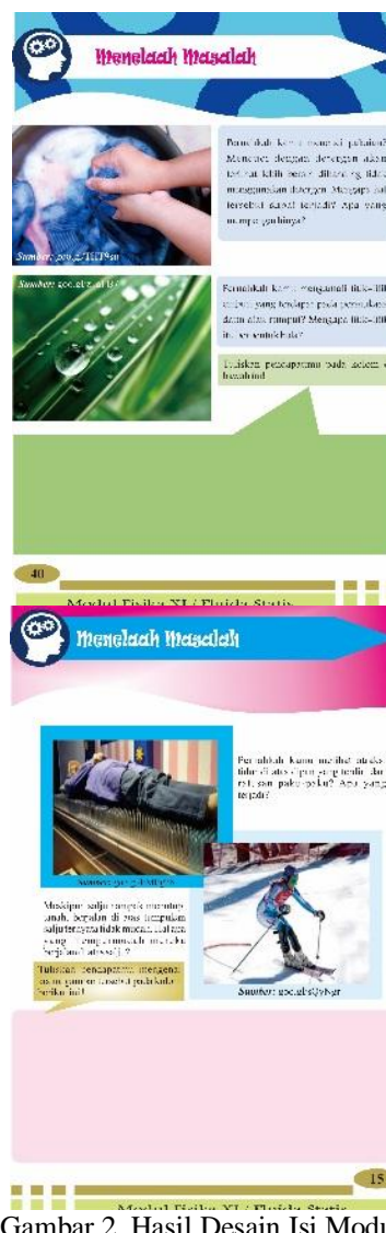
Gambar 2. Hasil Desain Isi Modul

Karakteristik modul problem solving ditampilkan dengan icon-nya masing-masing dalam setiap langkah kegiatan pembelajaran, dan untuk aspek high order thinking skill ditampilkan pada kegiatan evaluasi berupa soal esay. Di dalam modul berbasis problem solving ini disajikan beberapa video pada setiap sub pembahasan agar memudahkan siswa untuk mempelajari konsep fluida statis, video tersebut dapat diakses melalui barcode scanner .